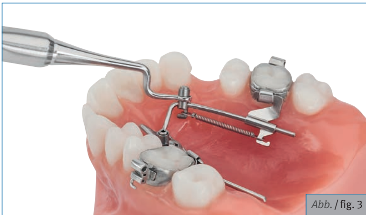
Abb. / fig. 3

The new Mobilholder is intended to move the BENEFIT® Mobilizers 33-54540 and 33-54541 into the final position prior to tightening the set screw for Distalization (fig. 1/2) or Mesialization (fig. 3).