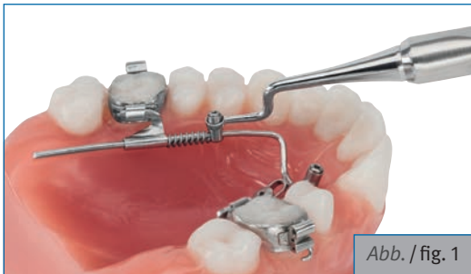
Abb. / fig. 1

Der neue Mobilholder kann verwendet werden um die BENEFIT® Mobilisatoren 33-54540 und 33-54541 für die Distalisierung (Abb. 1/2) oder Mesialisierung (Abb. 3) in die gewünschte Position zu bewegen.