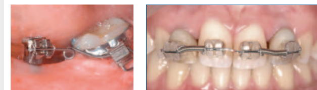
Für Kieferorthopäden und kieferorthopädisch tätige Zahnärzte (auch mit Zahntechniker)